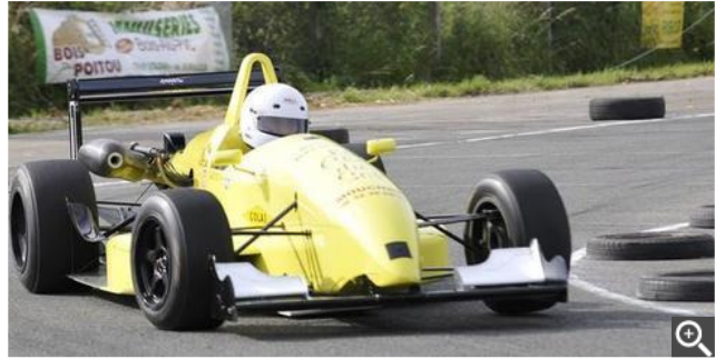
Et à la fin, c'est toujours le Gersois qui gagne... depuis trois ans. Mais ce n'est pas une fatalité.